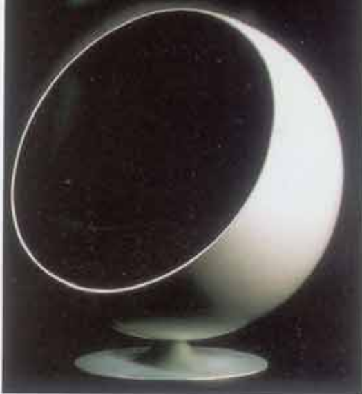
Eero Aarnion Pallo-tuoli (1963) herätti yleisön uteliaisuuden futuristisella muodollaan.

Muotoilun julkinen esittely on keskittynyt muotopuhtauden ja pintakuvioiden esitte-