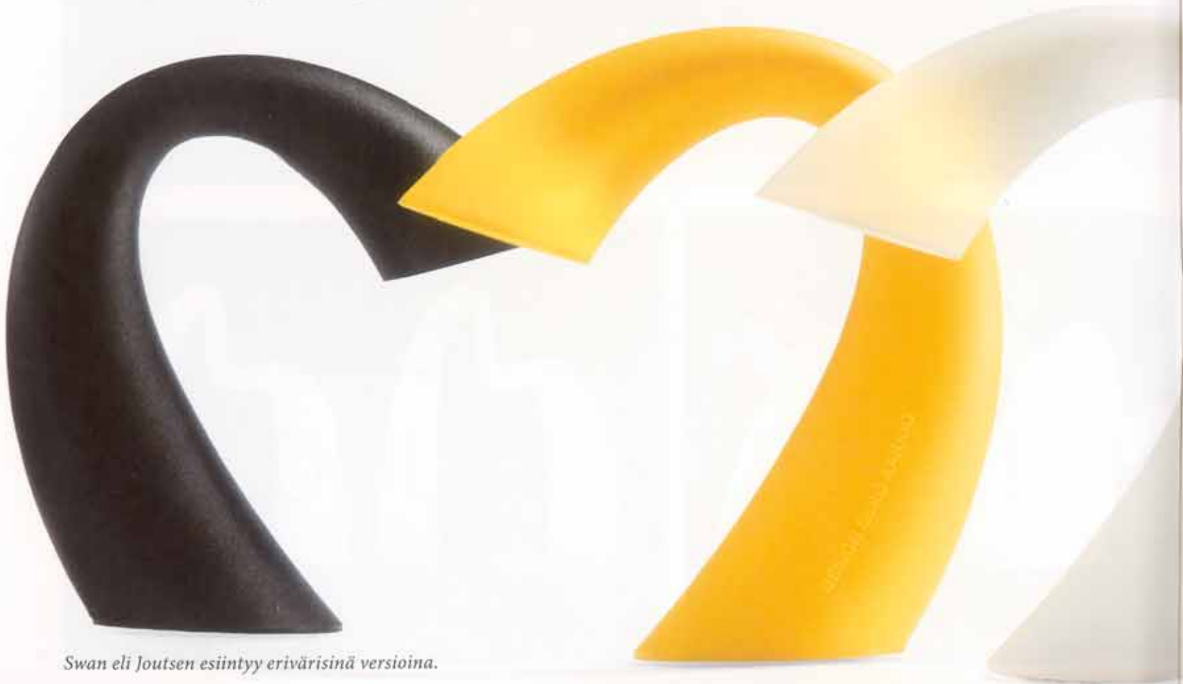
Swan eli Joutsen esiintyy erivärisinä versioina.

– Yleensä kotona vietetään illalla aikaa yhdessä pitempiä hetkiä, kun taas aamulla on kiire töihin. Iltavalaistus on näin ollen