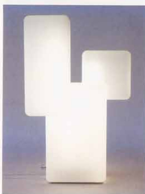
Cubo eli kuutio toimii myös kirkasvalolamppuna sekä pöydällä että lattialla.

Työnteko pitää virkeänä ja ideat tulevat samalla tavalla kuin nälkäkin, yhä uudelleen.