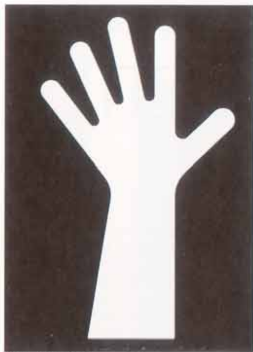
Hello! eli Käsi tervehtii huoneeseen tulijoita.