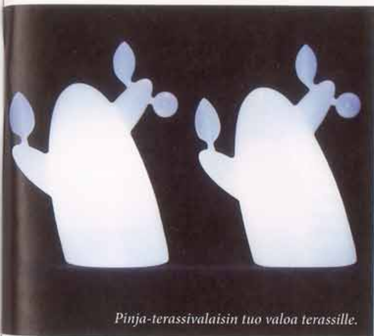
Pinja-terassivalaisin tuo valoa terassille.