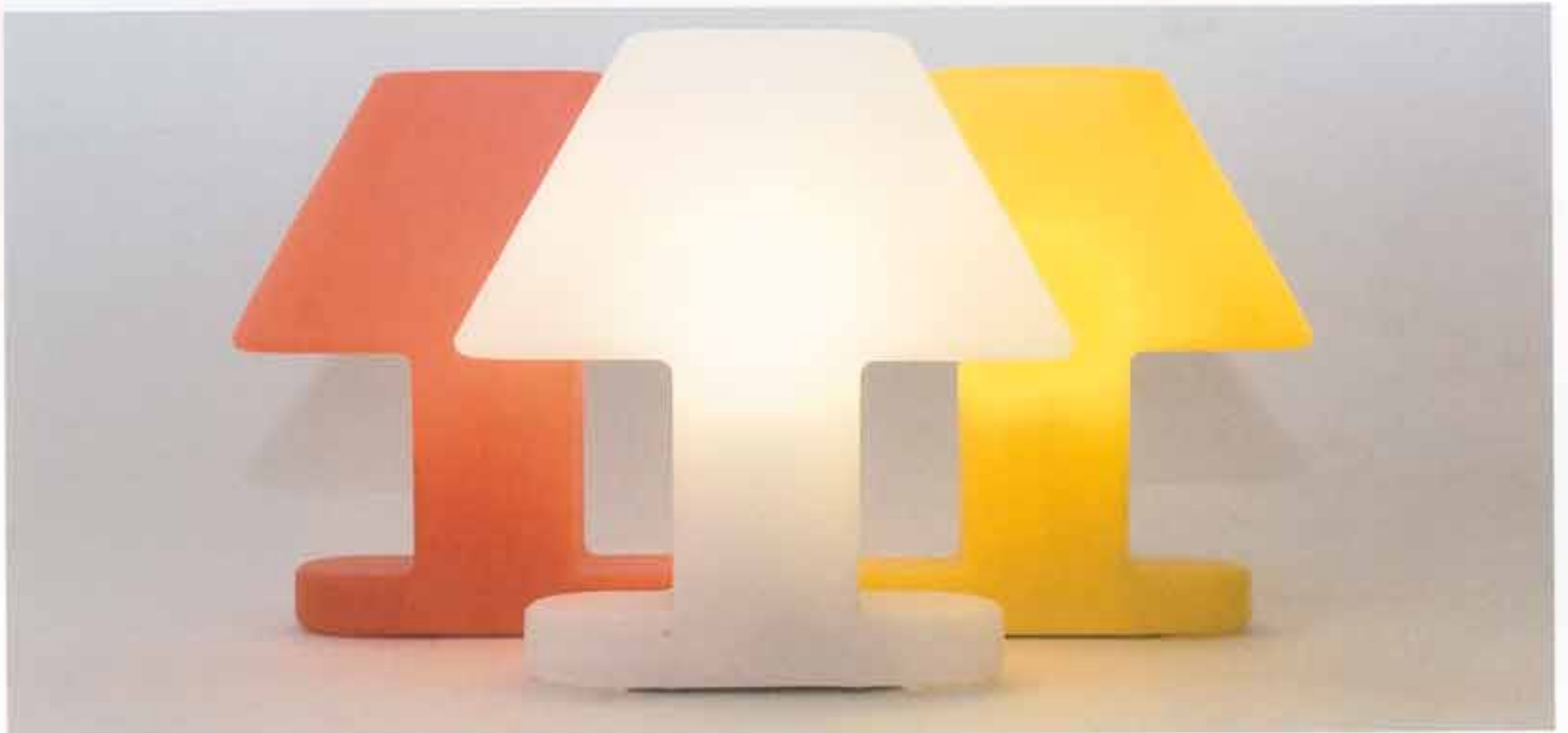
Flat Light, Litteä valo, sopii myös kapealle ikkunalaudalle.