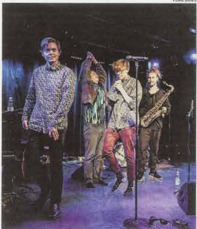
OK:KO-yhtye esittää modernia pohjoismaista jazzia.

Tempo on rauhallinen, ja tunnelma seesteinen.