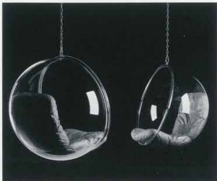
← Кресло Bubble. 1968 Bubble chair, 1968

Good design has no boundaries; it is international. Given that Finland has such a small population, it is surprisingly rich in good designers, compared to other bigger countries.