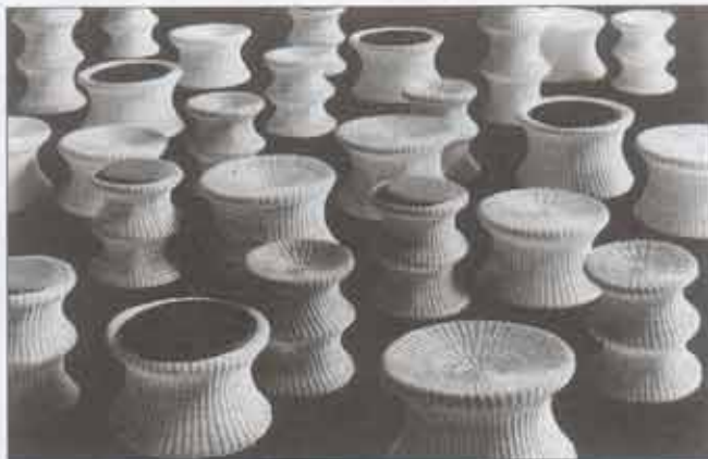
Paperikorista lähti innostus Juttujakkaraan. Jakkaroita on pieni, iso ja kakikerroksinen.

–Siinä lähdettiin keskeltä tekemään pyöreää esinettä. Ei ollut kovin vaikea homma minun mielestäni. Vuoksenniskalla punoin en-