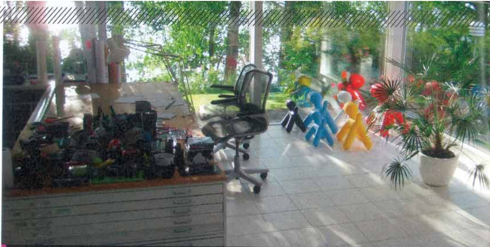
Olohuoneesta on suora käynti lasiseinien ympäröimään työtila-ateljeehen, joka on laajennettu alkuperäisen rakennuksen yhteyteen. Ateljeen työpöytä on luovuuden keidas.

” Täällä on paljon eri alojen suunnittelijoita, mutta myyntiä pitäisi opetella. Sen taitavat ruotsalaiset!