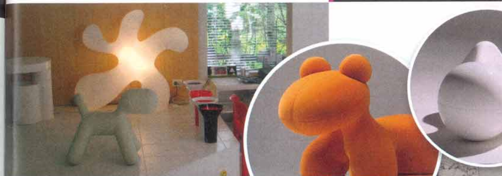
Talon sisustuksessa näkyvät oman tuotannon valaisimet.