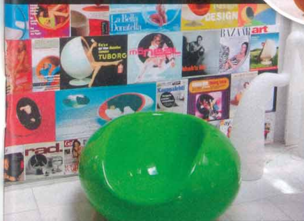
Olohuoneessa komeilee etusivun kansista muodostuva kuvakollaasi. Pastillituoli on vuodelta 1967. Aarnio palkittiin tuolin suunnittelusta American Industrial Design Awardilla.