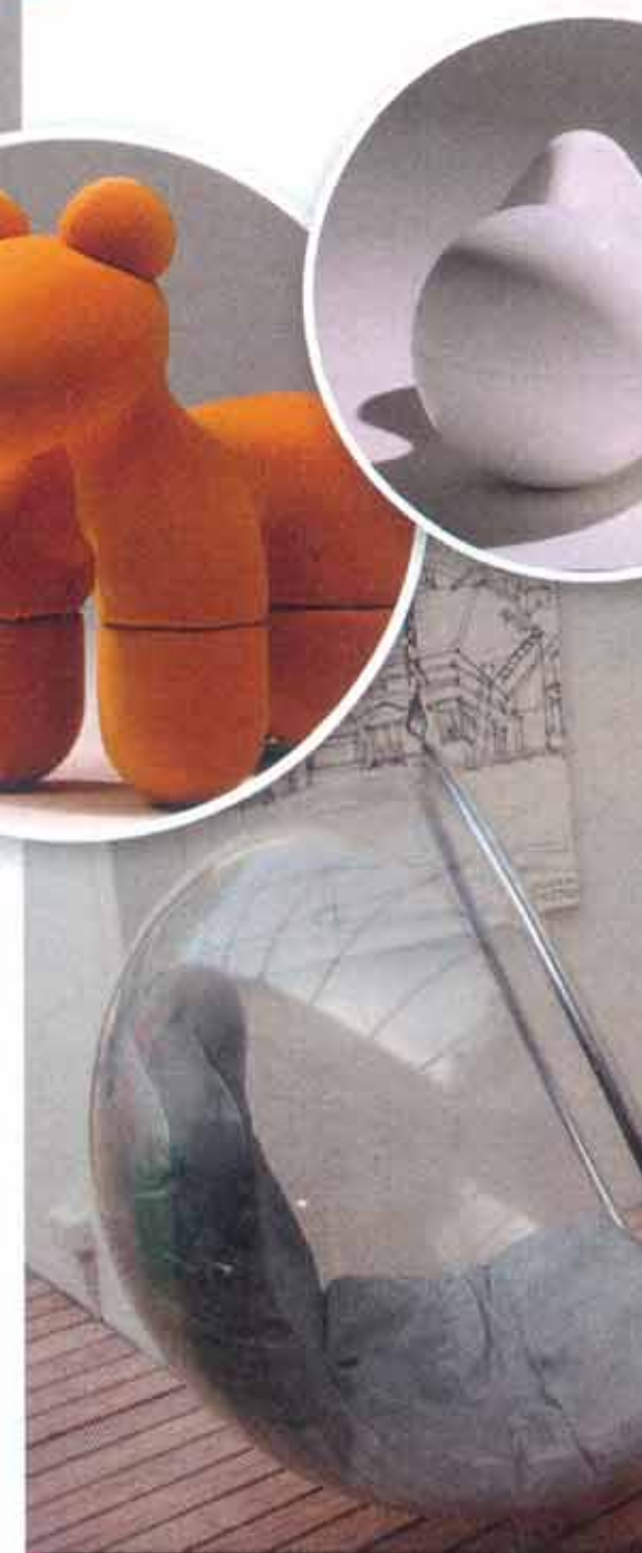
Useiden laajennusten jäljiltä kuvakodin ja vierastalon toisiinsa. 1960-luvun verhoiltu ja se päästää valon sisään.