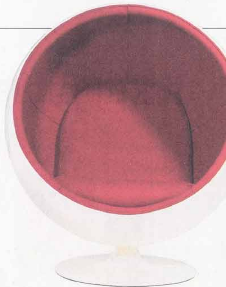
KOPIO Designers Revoltin jäljitelmä, hinta 1 795 euroa.

”Halpa kopio nurkassa ei tuo samaa nautintoa omistamisesta. Varsinkin kun samalla tietää, että se ei tue suomalaista teollisuutta.”