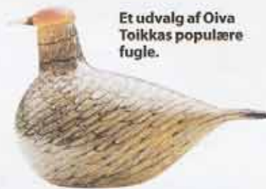
Et udvalg af Oiva Toikkas populære fugle.