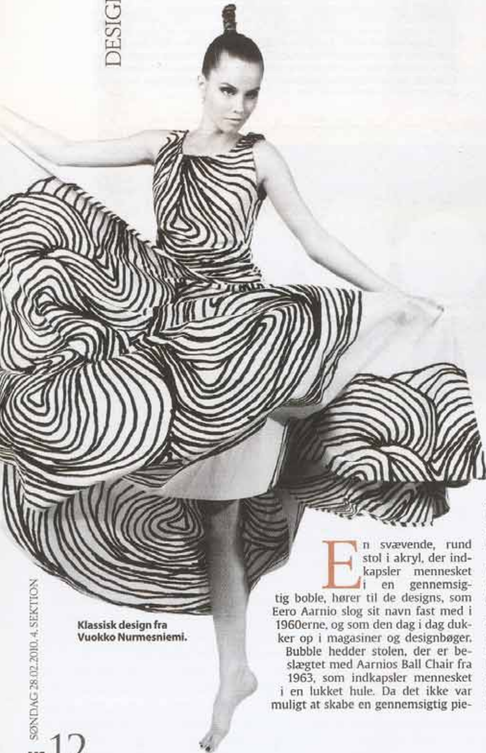
Klassisk design fra Vuokko Nurmesniemi.

E n svævende, rund stol i akryl, der indkapsler mennesket i en gennemsigtig boble, hører til de designs, som Eero Aarnio slog sit navn fast med i 1960'erne, og som den dag i dag dukker op i magasiner og designbøger. Bubble hedder stolen, der er beslægtet med Aarnios Ball Chair fra 1963, som indkapsler mennesket i en lukket hule. Da det ikke var muligt at skabe en gennemsigtig pie-