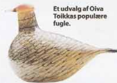
Et udvalg af Oiva Toikkas populære fugle.

struktør var, og da han umuligt kunne nå at skabe en specialdesignet serie, sendte han i stedet nogle smykker fra sin Silver Planet-kollektion.