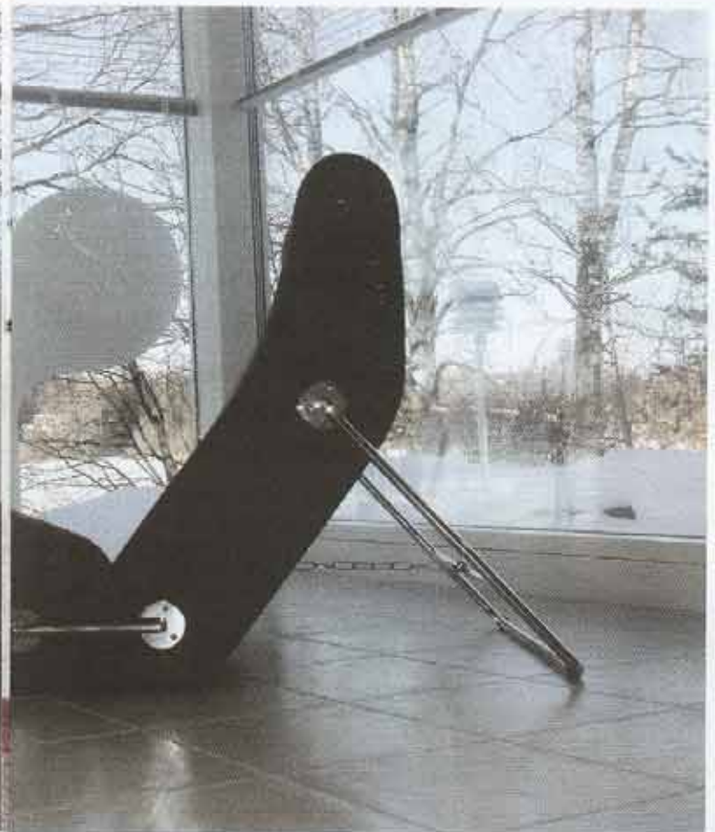
En af Eero Aarnios nyere lænestole.