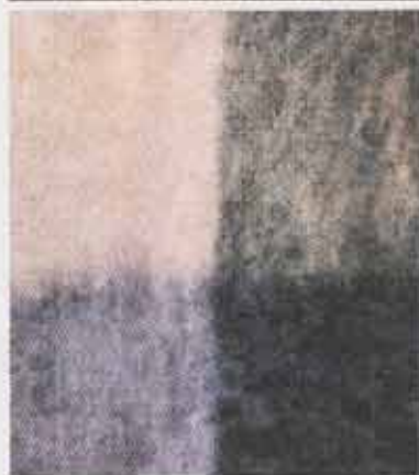
Eksempler på Rewells mohairplaider.