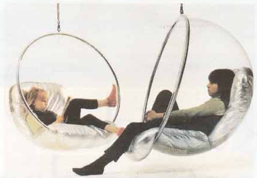
Eero Aarnios børn i Bubble, hvori også stjerner som Demi Moore og Donatella Versace har ladet sig fotografere i afklædt tilstand.