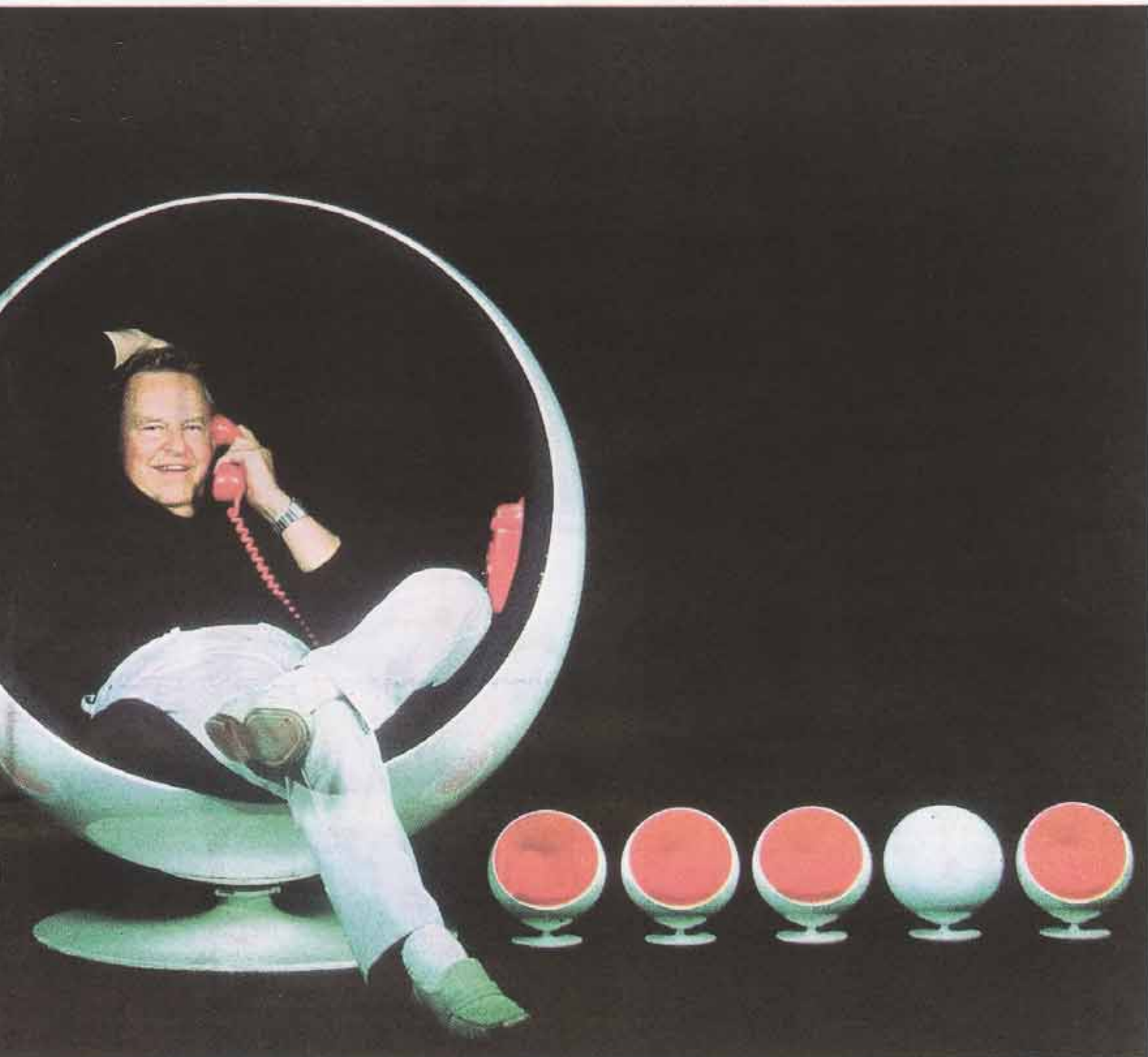
Eero Aarnio i sin ikoniske Ball Chair fra 1963.

Selvtilliden fejler da heller ikke noget hos den korpulente designer med det viltre hår. I løbet af efteråret har han designet et nyt teset, et spisesalsmøblement og, til børn, en serie plasticlænestole og en 130 centimeter lang og bevægelig dinosaur. Desuden arbejder han på en endnu hemmeligholdt serie for italienske Alessi.