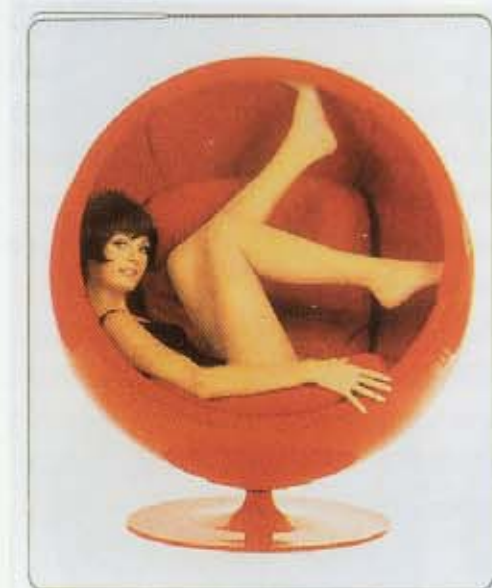
Pallotuoli Kunert-sukkahousu- pakkauksessa 1960-luvulla

E ero Aarnion tuolit ovat vahva osasuomalaisista identiteettiämme. Niiden kovat pinnat, kirkkaat värit ja virtaviivaiset muodot edustavat suomalaisuutta luonnonmateriaalien ja metsämaaisemien rinnalla.