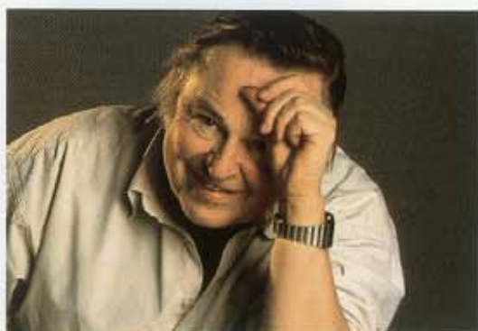
Eero Aarnio, sisustusarkkitehti, professori H.C.