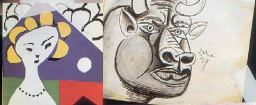
Arte amado: "Los colores de Matisse, la expresividad de Picasso y los trazos de Dufy". Starck (abajo, su sofá Privé ) "es mi creador favorito".