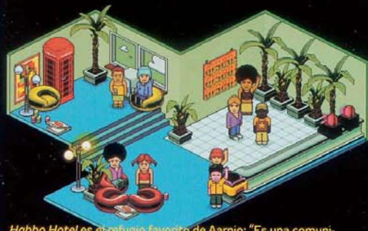
Habbo Hotel es el refugio favorito de Aarnio: "Es una comunidad on-line y un negocio exitoso". Izda., su casa en Helsinki: diseños propios, color blanco, luz a raudales y madera natural.