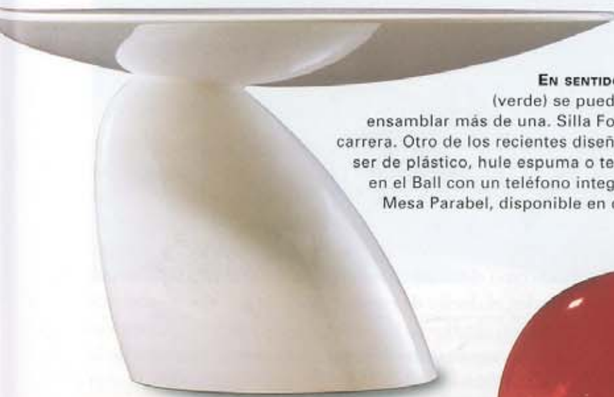
EN SENTIDO HORARIO: La mesa Copacabana (verde) se puede colocar individualmente o ensamblar más de una. Silla Formula, inspirada en los autos de carrera. Otro de los recientes diseños de Aarnio, la silla Focus puede ser de plástico, hule espuma o tela. Tomato Chair. El finlandés sentado en el Ball con un teléfono integrado. La silla Pastil de 1968. Mesa Parabel, disponible en diferentes tamaños.