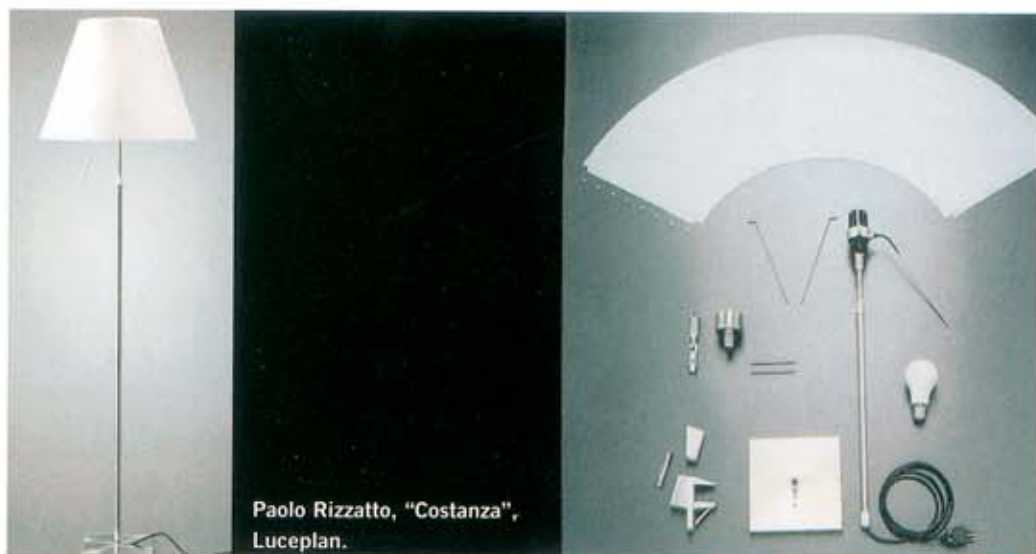
Paolo Rizzato, "Costanza", Luceplan.