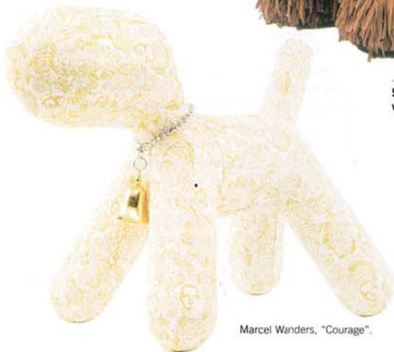
Marcel Wanders, "Courage".