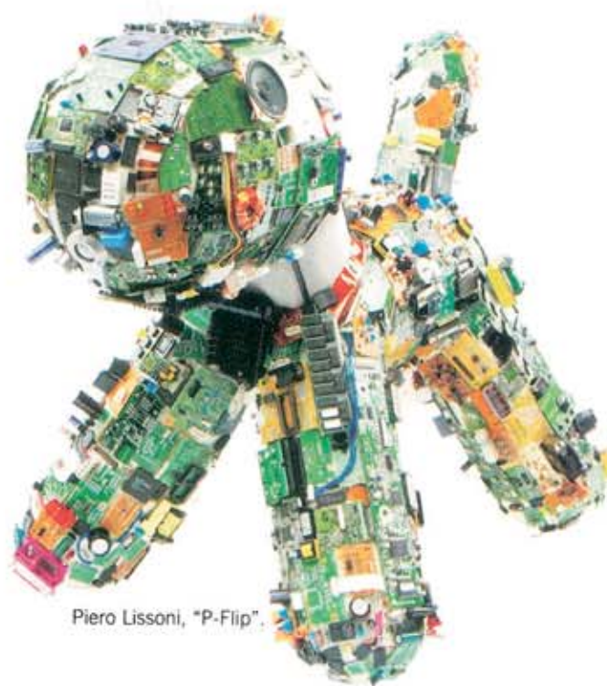
Piero Lissoni, "P-Flip".