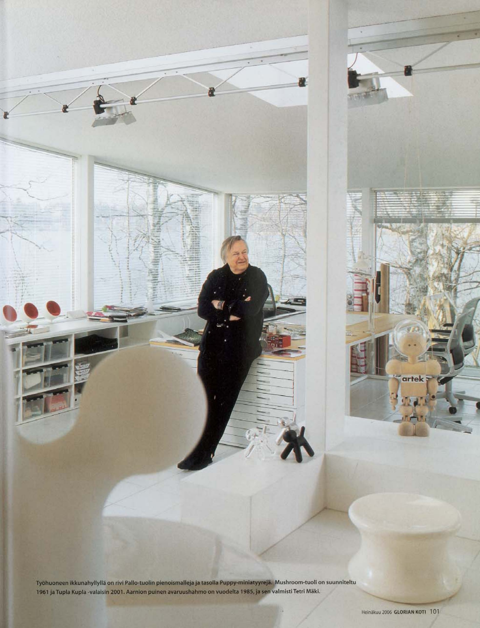
Työhuoneen ikkunahyllyllä on rivi Pallo-tuolin pienoismalleja ja tasolla Puppy-miniatyyrejä. Mushroom-tuoli on suunniteltu 1961 ja Tupla Kupla -valaisin 2001. Aarnion puinen avaruushähmo on vuodelta 1985, ja sen valmisti Tetri Mäki.