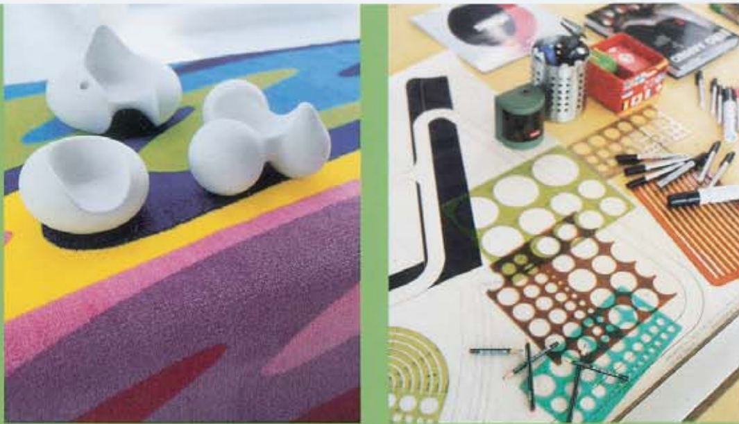
Yllä vasemmalla: Klassikkokalusteiden pienoismalleja valmistaa Vitra Design Museum. Takana Formula tuoli vuodelta 1998, vasemmalla Pastilli-tuoli, 1967, ja vieressä Tomaatti-tuoli, 1971. Alustana olevaa Lentävää mattoa valmistaa Magis. Yllä oikealla: Muotoilijan tärkeät työvälineet. Kuvassa näkyy Artekille suunniteltu tuoli.

Aarnio kiteyttää työnsä sanoihin luovuus, leikki ja huumori.