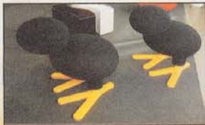
TIP: Den tugeleignende kosestolen «Tipi» koster 16 600 kroner.