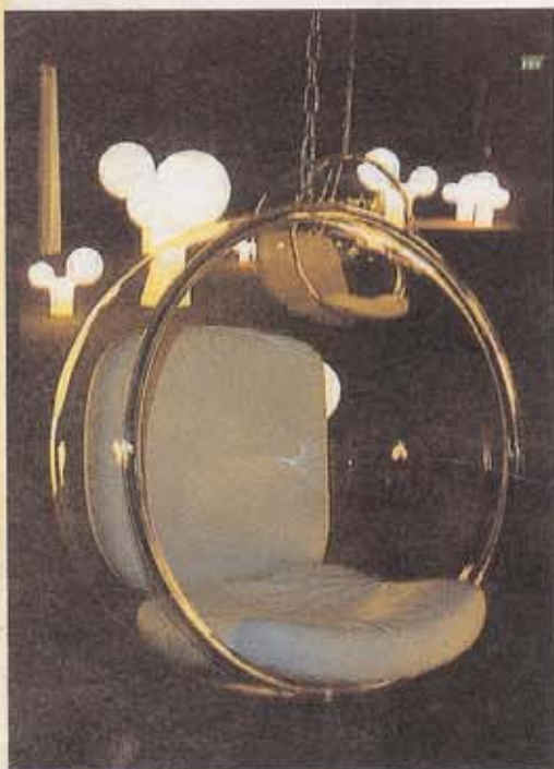
HENGESTOL: «Bubble chair» heter denne stolen som Eero Aarnio designet i 1968. «Double bubble» heter lampene som Aarnio designet i 2003. Den største koster 11 490 kroner. De minste 3490.