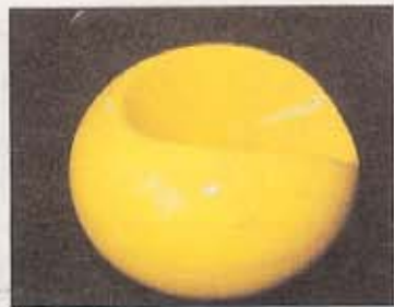
PASTILLEN: Denne stolen var allmannseie i Finland på slutten av 1960-tallet. I dag koster den 13 000 kroner.