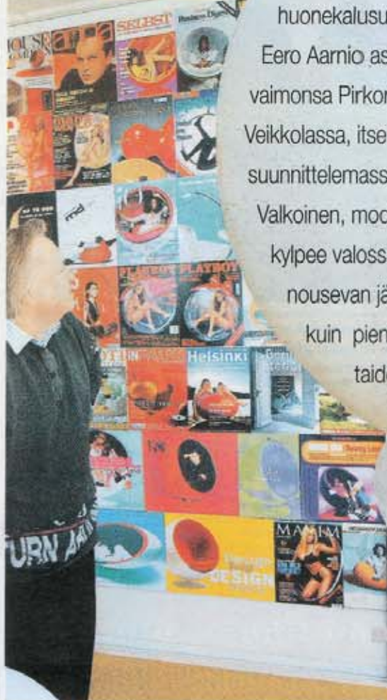
Olohuoneen liukuva seinäpaneeli on vuorattu lehtien kansikuvilla. Ne kertovat Aarnion aikaansaannoksista.