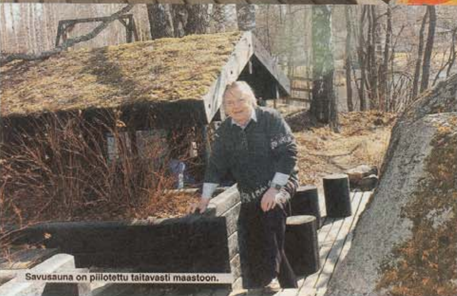
Savusauna on piilotettu taitavasti maastoon.