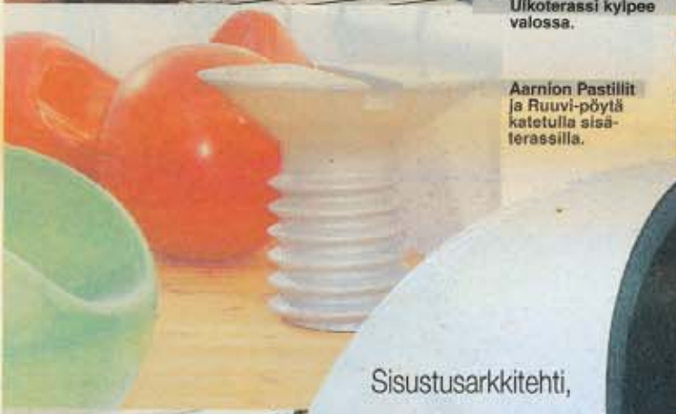
Aarnion Pastillit ja Ruuvi-pöytä katetulla sisä-terassilla.