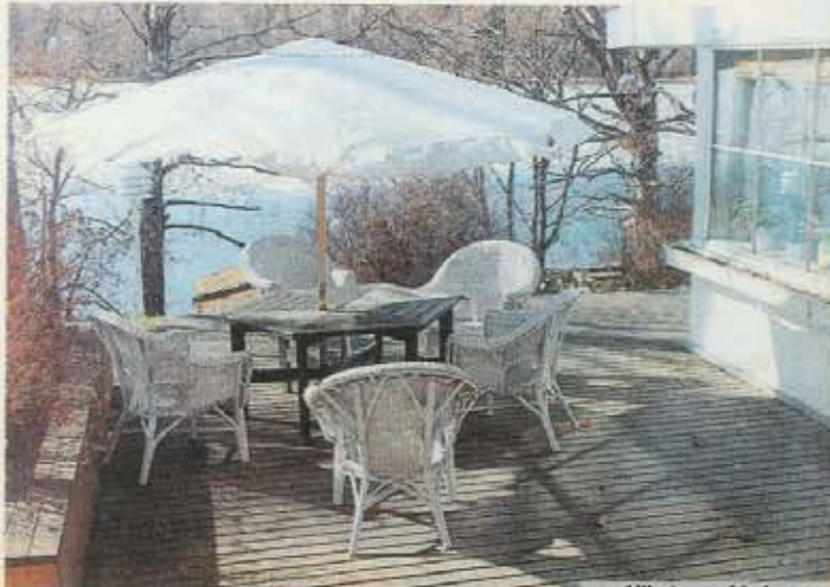
Ulkoterassi kylpee valossa.