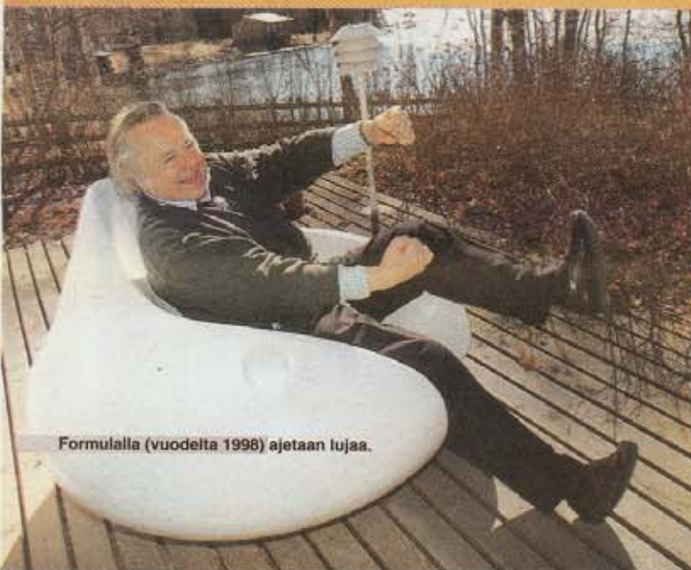
Formulalla (vuodelta 1998) ajetaan tujaa.