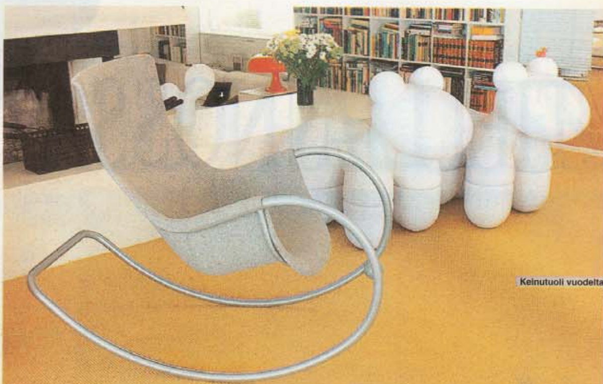
Keinutuoli vuodelta 2001 ja Ponit vuodelta 1972.

S aksalainen Adelta-Huonekaluyritys alkoi