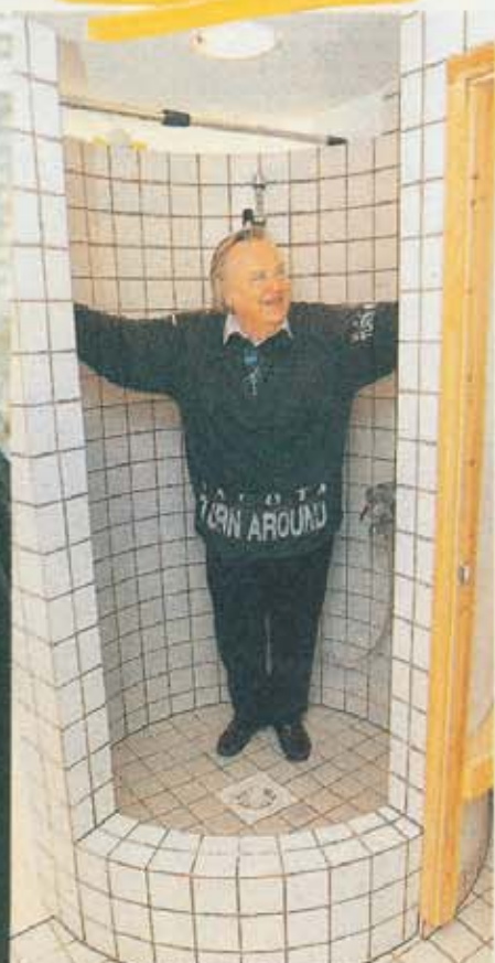
Suihkutila mittojen mukaan.