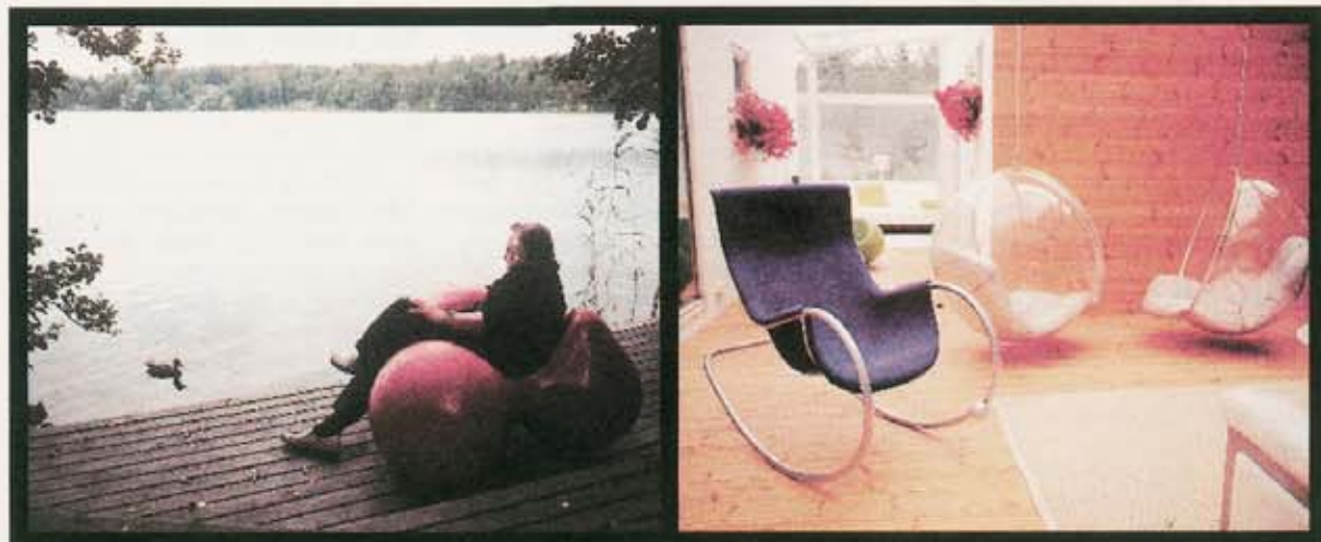
Aarnio asuu Kirkkonummella, Lamminjärven rannassa. Sisällä talossa uusi keinutuoli seurustelee Kuplien kanssa.

” Jostain syystä tytöt aina ottavat vaatteensa pois minun tuoleissani.