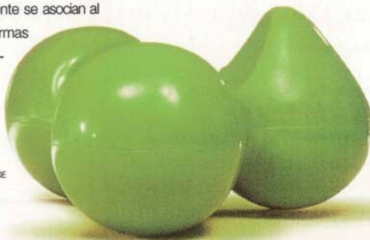
"TOMATO CHAIR" / EERO AARNIO / DELTA / WWW.ADELTA.DE

By 1915, the Swedish Society of Arts and Crafts already maintained that everyday objects should be distinguished for their beauty and functionality. Thus, since the 1930s, Scandinavian industrialists have been applying the same principles of design that are still associated with Scandinavian design: distinct, simple forms, maximum usefulness and high manufacturing quality.