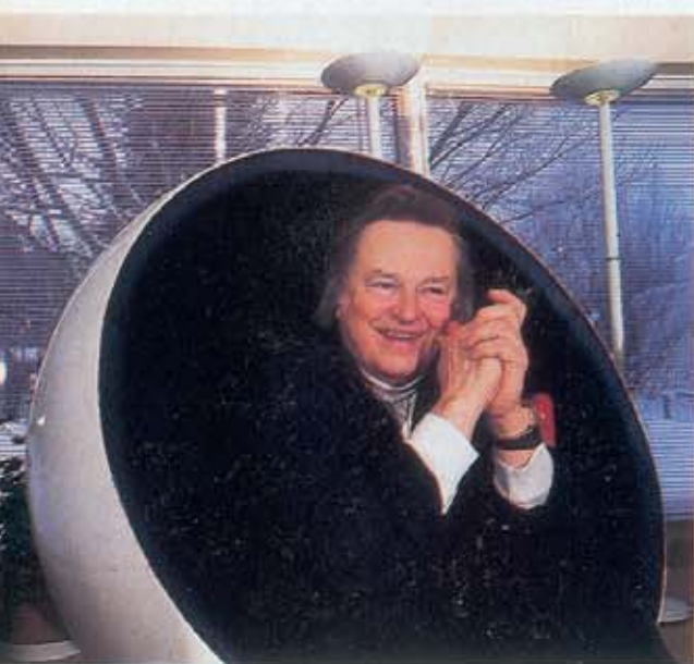
Pallotuoli veti Eero Aarnion jo 60-luvulla lasikuultusuunnittelijoiden kärkikaartiin.