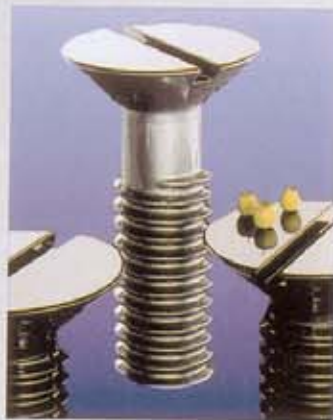
EERO AARNION KOKOELMA ADELTA: RUUVIPIÖYTÄ, TOMAATTITUOLI JA COPACABANA-PÖYTÄ.

MITÄ ON TEKEILLÄ, MITÄ EI? MASSAT JA MUODOLLISUUDET? YHTÄ "OUT" KUIN ITSE SANAKIN