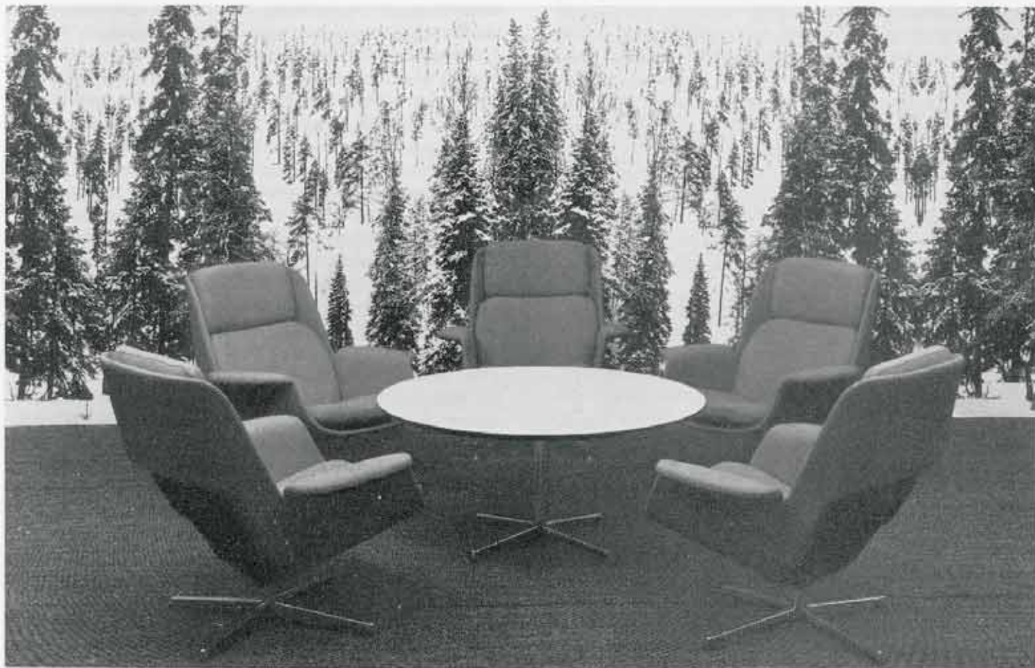
Rondo-tuolin on suunnitellut sis.arkkitehti Olli Borg.

Kun messuilla odotettiin käyvän yli 70.000 ostajaa eri puolilta maapalloa, on messujen merkitys huonekaluteollisuudellemme ja nimenomaan sen viennille erittäin suuri. Huonekaluviennin alkaneelle kasvulle on Kölnin messuilla erittäin vilkastuttava vaikutus, kun vielä voidaan todeta, että maastamme oli näille messuille lähetetty huonekalu, joka varmasti sattuu jokaisen kävijän silmään, ja siitä puhuttiin.