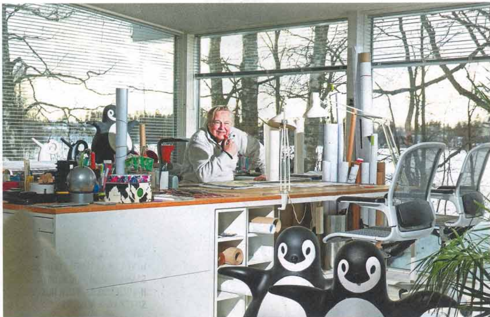
AARNION koti pursuaa upeita huonekaluja ja ikkunoista aukeaa huikeaseva järvimaisema. Ennen upeaan kotiinsa muuttoa heillä ehti olla 16 eri osoitetta.

Ratkaisevaa oli, kun tuolin aukon sisäpuolelle rakennettiin teräsputki. Enää oli vain yksi ongelma: miten tuoli saataisiin markkinoille?