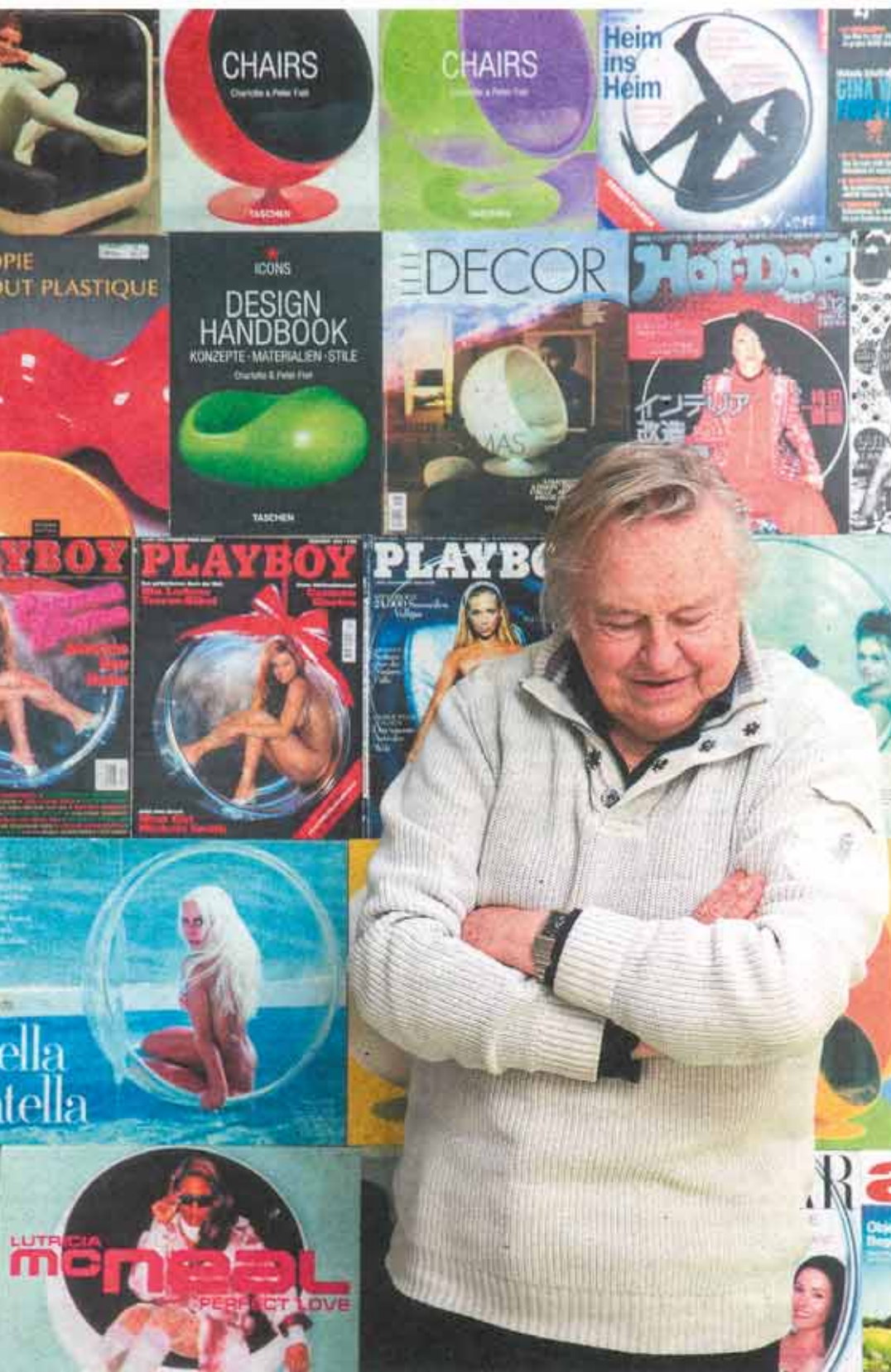
AARNIO TAJUSI jo varhaisessa vaiheessa, ettei riitä, että hän on omaperäinen muotoilija. Pitää rakentaa myös brändiään.