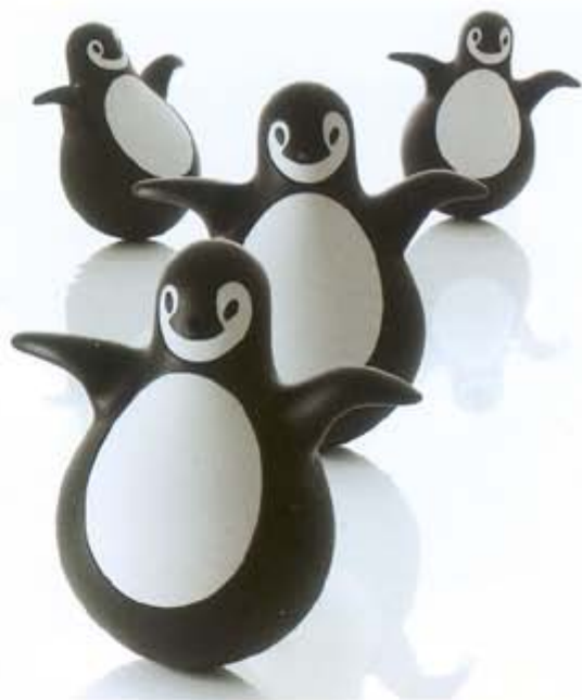
(上左)为 Martela 公司设计的树型衣帽架“The Tree”。 (上右)为 Magis 公司设计的儿童玩具“Pingy”。 (中)厨房用的小鸭子定时器“Duck Timer”。 (下)为 Martela 公司设计的摇椅“Rocking Chair”。