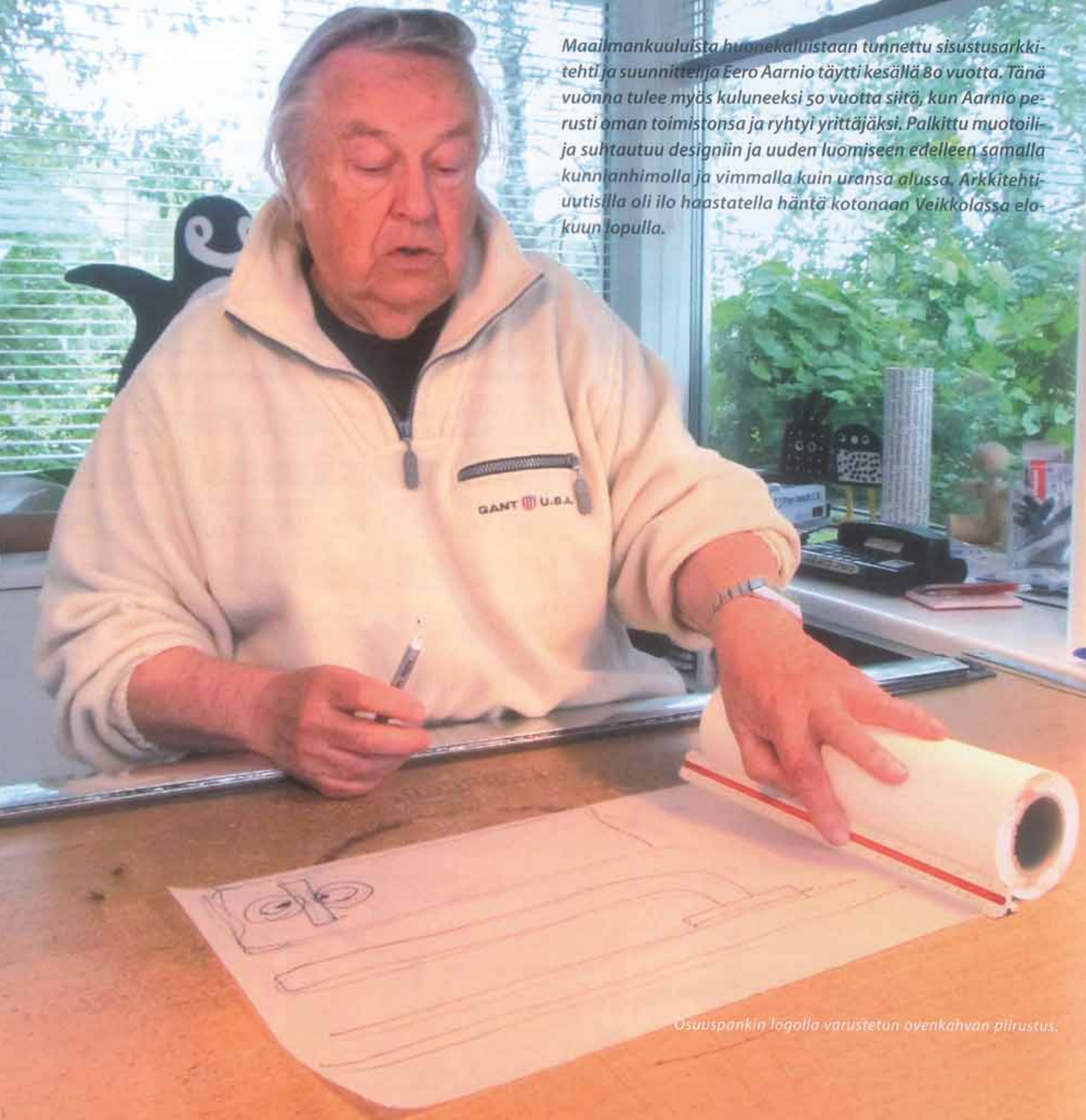
Osuuspankin logolla varustetun ovenkahvan piirustus.

Maailmankuuluista huonekaluistaan tunnettu sisustusarkkitehti ja suunnittelija Eero Aarnio täytti kesällä 80 vuotta. Tänä vuonna tulee myös kuluneeksi 50 vuotta siitä, kun Aarnio perusti oman toimistonsa ja ryhtyi yrittäjäksi. Palkittu muotoilija suhtautuu designiin ja uuden luomiseen edelleen samalla kunnianhimmolla ja vimmallalla kuin uransa alussa. Arkkitehtiuutisilla oli ilo haastatella häntä kotonaan Veikkolassa elokuun lopulla.